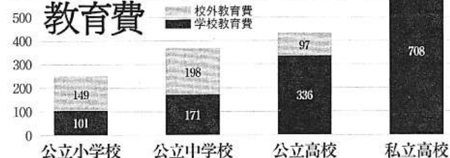
文科省2006年度「子どもの学習費調査」 この図表は年収400万円以下にかぎって図示したもののだが、学校にかかわる費用の大きさは年収によってほとんど違いがない。つまり、学校教育の費用は、消費税などと同様、収入に対してまったく「逆進的」だ。